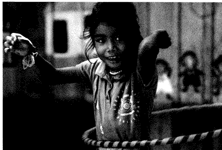
バンキアン地区保育所