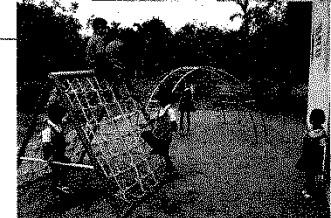
スックソムラン保育所