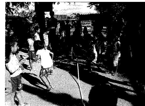
大縄とびで遊ぶ コー第1村保育所

前期でしたが、大きな天気の崩れもなく、ツアーは順調に進められました。保育所支援として、遊具のペンキ塗りや、子どもたちへの教育とふれあいの一環として、折り紙や大縄とびをしました。また、カンボジアではゴミを拾う習慣がないため、子どもと一緒にゴミ拾いを行い、環境保全の教育もできました。私たちは、これまでの取り組みとして「みんなで布チヨッキン(※)」を行ってきたので、今回は切った