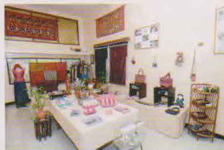
ショップ。