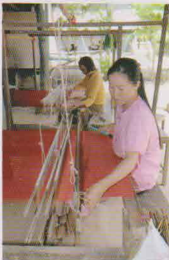
自宅で織る研修修了生