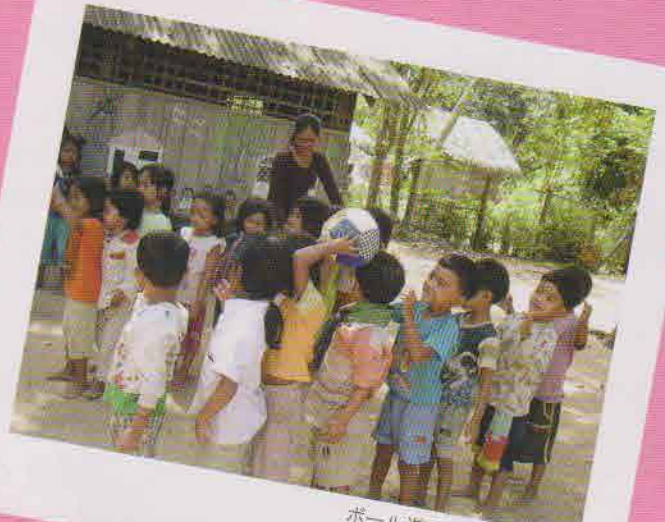
ボール遊びを覚えたよ!!