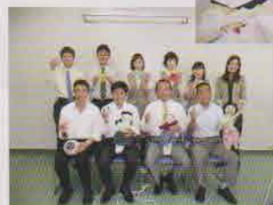
作業後に!キッコーマン様