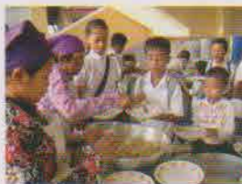
順番に並んで並んで