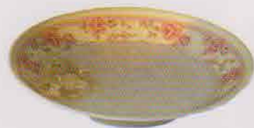
ひき肉と玉ねぎの卵炒め&お粥

カンボジアの子どもたちが食べている給食のレシピを、連載でご紹介します。 ぜひ作ってみてください♪