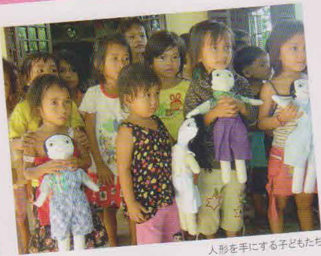
人形を手にする子どもたち