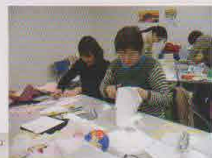
布切りに集中 (特活)WE2\ジャパンひらつか