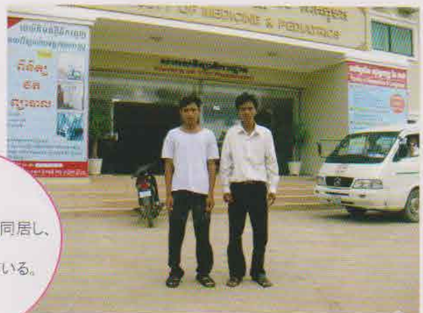
U大学の前で、いとこと一緒に

同じ学校に通ういとこと同居し、 月々の家賃$30と、 光熱費$10を折半している。