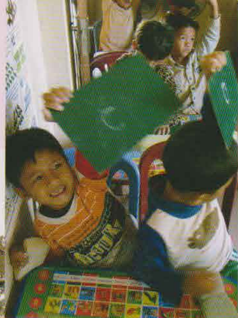
右：ローコンバオ保育所で文字を学ぶ 左：池の上に建てられた住居

ローコンバオ保育所に通う子どもたちの家庭訪問に、同行させていただきました。プノンペン中心部から車で20分ぐらいのところ、貧困層が多く住んでいる地域です。汚いどぶ池沿いに、小さな家が30軒ぐらい並んでいました。道は赤い粘土質でぐちゃぐちゃで、そこに豚とにわとりが放し飼いにされていました。家の中では豚と人が一緒に生活していて、ガスも水道もなく、水は雨水を溜めて使っていました。共同トイレがありましたが、汚れていて使える状態ではありませんでした。