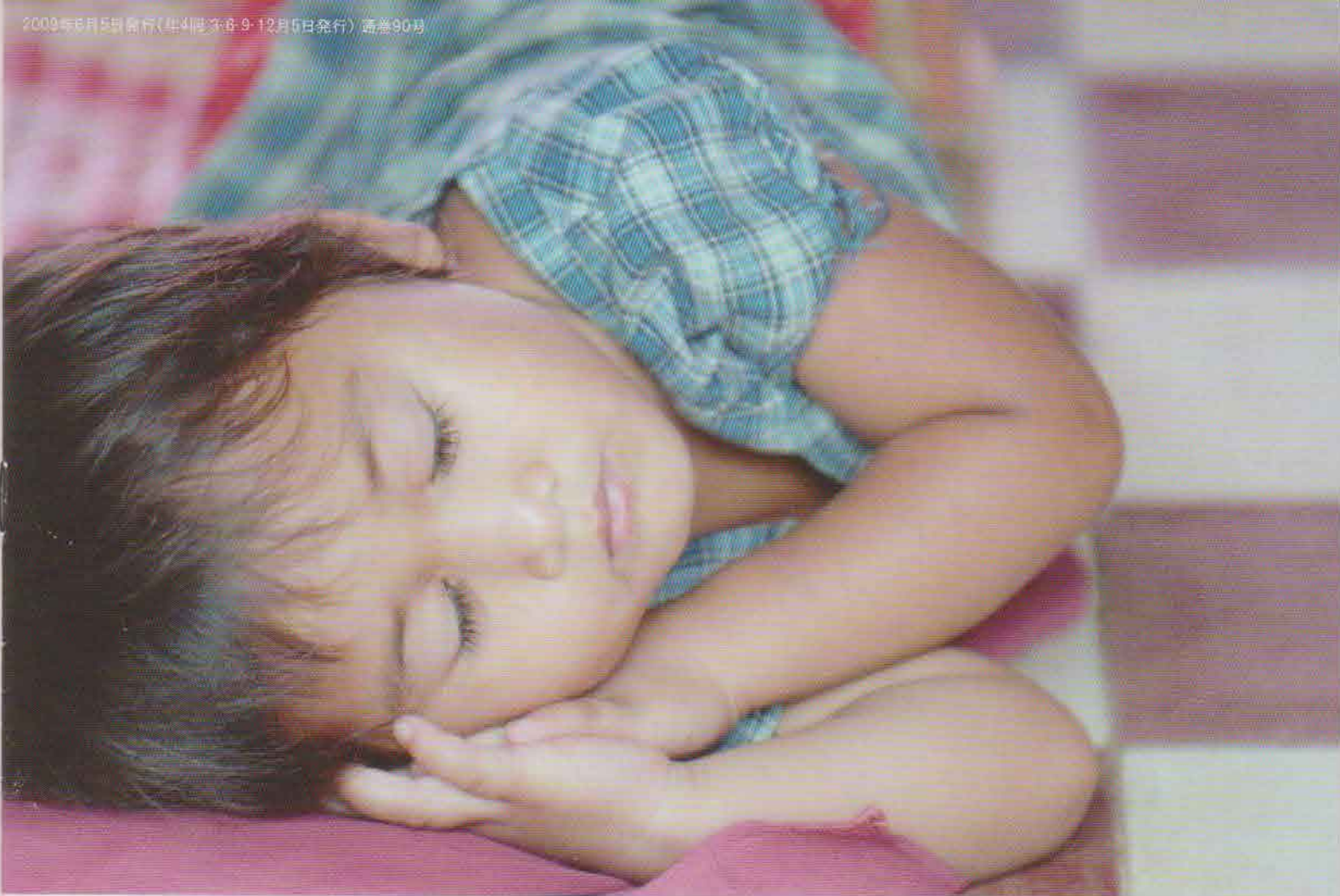
バンキアン地区保育所