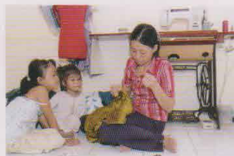
縫製作業。ひとつひとつ丁寧に仕上げます。©小林正典