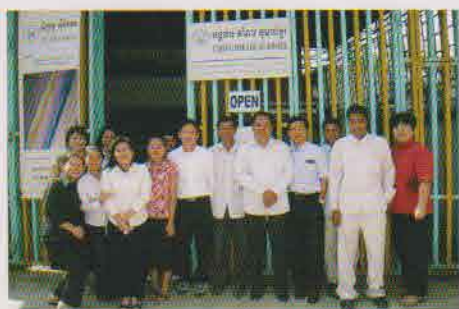
ショップの前で、スタッフみんな集まれ！