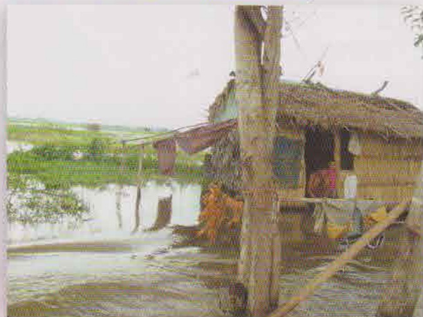
2011年 タプロム村：家屋に迫る水