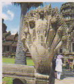
ナーガ神の像。ナーガは、伝統の絹織物ヒタン（絵紺）のモチーフにも使われます。

印 象に残っているのは、随所に「この場所は〇〇の支援で修復されています」という看板があったこと。文化財保護も諸外国の援助で行われていることに、カンボジアの現状を垣間見た気がします。