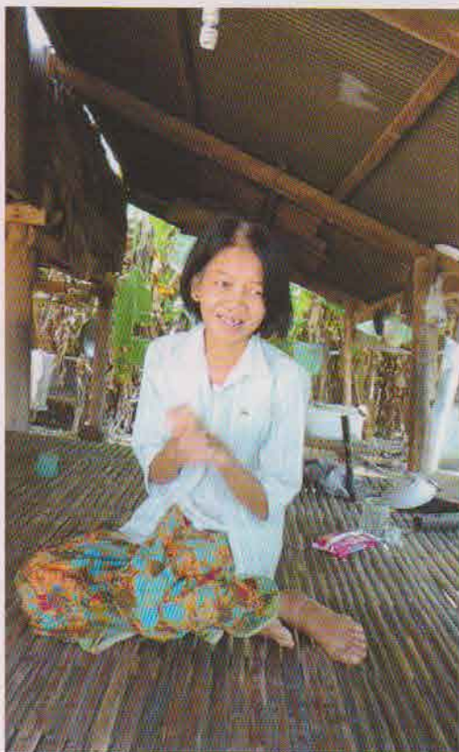
ソクンさんの母親（上）と、彼女が営む店（右上）

の場合、保育所に通う子どもや卒園した子どもの人数だけで活動を評価することはできません。彼らがどのような道を歩んでいるのか、保護者や学校の先生は、保育所に意義を見出しているのか。そ