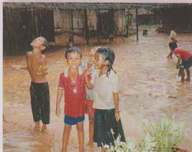
1990年 カオイダン難民キャンプ： 水浴び代わりに雨を浴びる子どもたち

【雨：ភ្លៀស (プリアン)】 水の確保が難しいカンボジアで、雨は天の恵みだ。家の軒にとりつけた水瓶に溜めた雨水は、さまざまな用途に使われる。収穫も天候次第。降雨が人びとの生活の基盤になっていると言える。しかし、ひとたび牙をむいた自然ほど恐ろしいものはない。昨年、タイとカンボジアを襲った豪雨による被害は、未だ記憶に新しい。今年も時期外れに降った大雨に、農民は田植えの時期を計りあぐねている。