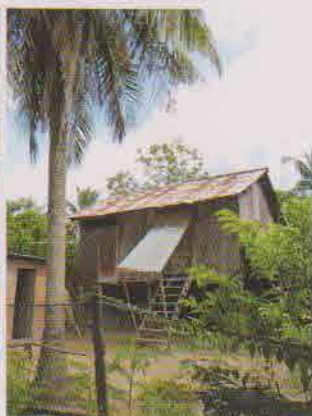
ソクンさん親子が住む家