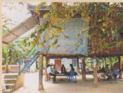
高床の下で話を聞いた

同地域に住むカンボジア人保育者が、担当者として戸別訪問で面接を行っています。過去3回実施した調査の結果、保育者が自分の担う役割を再認識するという派生的成果も得ました。