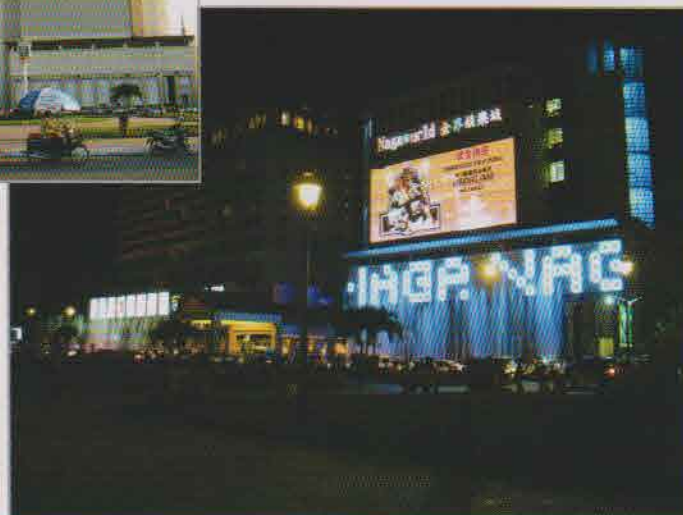
プノンベンのカジノ、夜になるとネオンを放つ