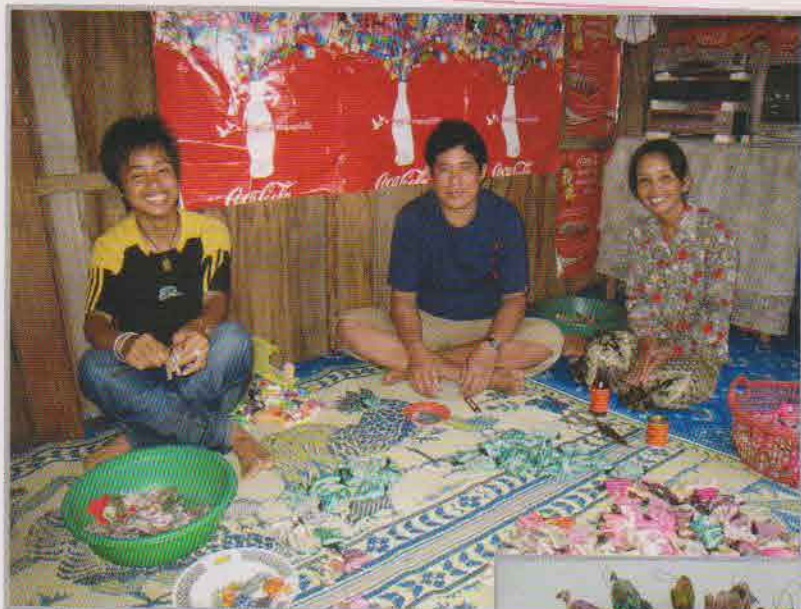
左:ウンさん家族 右:マスコット製品

近所でマスコットづくりをしている人がいたので、それを見ながら独学で縫製を学びました。ミシンは、障害者を支援する団体からもらうことができました。地雷で被害を受けた兄がそこで働いているんです。当時は、自分でマスコットを売りに市場へ行っていましたね。CYRの仕事は、カンボジアのNGOの紹介を受けて2006年から始めました。家にいる夫と息子にも手伝ってもらいながら、ゾウ、ウマ、ブタなどのマスコットを縫っています。私が縫製をして息子が綿を詰めた後、夫が目や鼻などをつけます。家族3人でがんばっています。