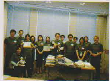
活動後に全員集合

私とCYRさんとの出会いは、社内のボランティア・プログラムを通じて参加した「布チョッキン」活動です。ゴールドマン・サックスは、地域コミュニティにおいて良き企業市民としての役割を果たすべく、地域に根ざした貢献活動を目指し、様々なコミュニティ活動を行っています。こうした地域活動への参加は、ゴールドマン・サックスの文化・伝統の一つと考えられています。「布チョッキン」活動へのボランティア協力も、こういったコミュニティ活動の一環で、今年で4年目を迎えます。その間、延べ278人の社員ボランティアが参加し、カンボジアの子どもたちのために用意した布はボール411個分、お人形711体分になりました。