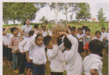
モンドルキリ州（カンボジア最東部、ベトナムに隣接）の研修は2006年の初回以来9年ぶりに復活し、州内6幼稚園で子どもたちを入れて実習した。2013年7月