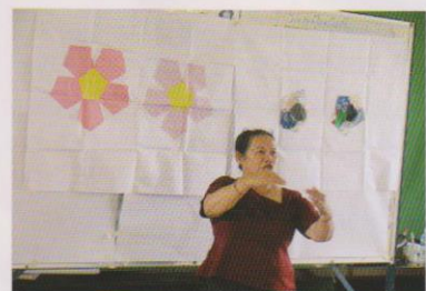
ウッドミエンチェイ州（カンボジア最北西部、タイに隣接）の初回保育研修会。受講生56名に布ボールの縫い方を説明する教育省担当官。2013年9月