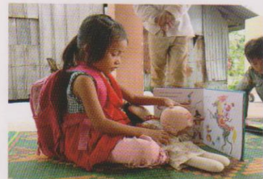
ボール・人形を仲間に見せながら遊ぶ子、大きなカバンは離さない。トロビエンクローライン村幼稚園、2013年11月

次号では、全国各地の企業や団体で活躍する社会貢献グループの方々の声をお伝えする予定です。